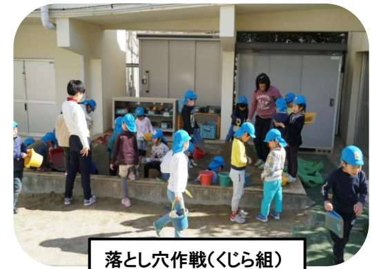
落とし穴作戦(くじら組)

自分の心と向き合う・・・ 「怖い！」「でもがんばるぞ！」と気持ちを 高めるくじら組