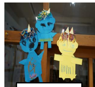
鬼の切り貼り (いるか組)