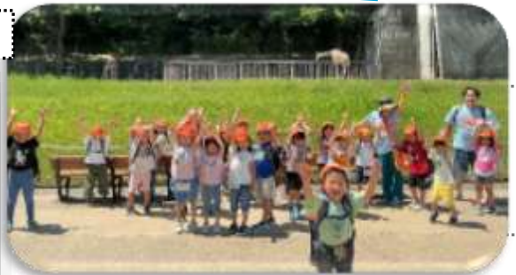
みんなで「きりん」 (5歳児くじら組)