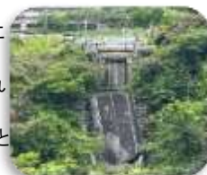
被災した阿蘇大橋

避難訓練後、必ず職員間で振り返りし、様々な状況で保育をしている職員の声も聞いています。自分たちの「どう動くべきか」「連携をとって役割分担を迅速にするには」等を共有することを大切にしています。ご家庭でも万が一に備えている事があれば、またお聞かせください。