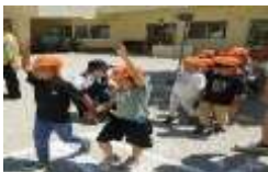
「右見て、左見て、右見て」「手をあげて渡ろう!」