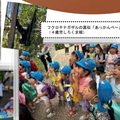
フクロテナガザルの真似「あっかんべ〜」 (4歳児しろくま組)