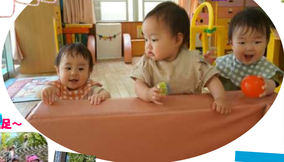
「ハイハイで先生に向かって 「ばあ〜！」(0歳児めだか組)