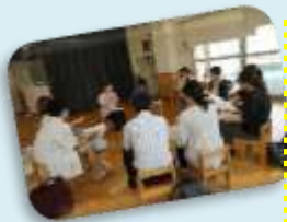
「我が家の話をうなずきながら聞き入る0歳児あめんぼ・めだか組の保護者」

「我が家の話をうなずきながら聞き入る0歳児あめんぼ・めだか組の保護者」 あめんぼ・めだか組ときんぎょ組(五月二十六日)を皮切りに懇談会が始まりました。 ・「普段の様子や楽しそうに過ごしている姿を見られてうれしかったです。」 ・「子どもの食事の事、日々のタイムスケジュールについての悩みどころ、奮闘しどころは皆さん一緒に我が家だけでは無いんだなとホッとしました。」 ・「保護者の方々と子どもについて色々とお話することができ共感できる部分も多くとっても参考になりました。」など、たくさんの感想が寄せられました。