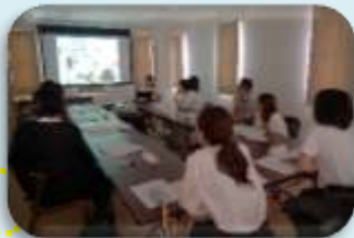
保育園での様子の動画を見て思わず笑み がこぼれる1歳児きんぎょ組の保護者

新年度が始まって保護者の方と担任が一堂に会する初の場が懇談会。話し合いでは、各年齢の発達とあわせて、大切にしたいことを確認しました。子どものかわいいところや困っているところなど、家庭の現実がうんと語られ、「うんうん」「あるある」とうなずく姿がありました。園や家庭の状況を語り合うことで、心が軽くなり、子育てを楽しみ引き出しを増やしていったらいいですね。保育士と親、親と親がつながり合い、子育ての仲間がいることの安心感の中で、子どもがかわいさや成長を共に喜び合える関係をつくっていききたいですね。