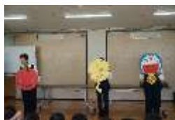
信号の赤青黄をわかりやすく。