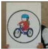
自転車はヘルメットを必ずかぶろうね。

区役所から交通指導員、名東警察の交通安全課、合わせて7名の方が来られました。しろくま組(4歳児)くじら組(5歳児)はいあいホールで紙芝居や手品で交通安全のルールをわかりやすく教えていただきました。園庭ではいるか組(3歳児)も参加して簡易横断歩道を先生と一緒に渡る練習をしました。学区の交通指導員さんが「新1年生の交通事故がとても多い」とおっしゃっていたのが印象的でした。子どもの手をつないで歩く保育園時代を大切に交通ルールも伝えていきたいですね。