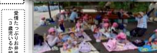
愛情たっぷりお弁当！ (3歳児いるか組)

新年度が始まって2カ月が過ぎ、園内で子どもたちと保育士の笑い声が響いています。「先生と一緒に！友だちとおんなじ！楽しいね」「楽しかったね！またやろうね。」と満足する生活、心地よい関係を大事にしていきたいものです。