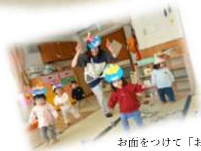
お面をつけて「お～にだぞ～！」 (0歳児 めだか組)

かつて子どもたちの周りには身近に自然や暗闇など、「怖い」ものがありました。今は夜でも街は明るく、ゲームやテレビなどバーチャルの世界が子どもたちを取り巻き、指一本で簡単にリセットできる時代。そんな時代にいる子どもたちに実体験で心が動かされる体験をしてほしい。そんな願いが名東保育園の節分にはこめられています。