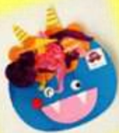
和紙でオニの髪を つけたよ (0歳児 めだか組)