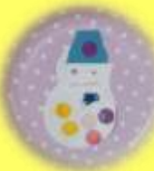
顔を描いて帽子を貼って 雪だるま (3歳児 いるか組)