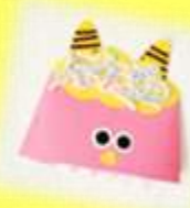
毛糸で髪の毛を 付けた鬼の帽子 (1歳児 かに組)