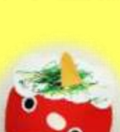
ペンで髪を描いて顔も 貼ってつくったよ！ (1歳児 きんぎょ組)