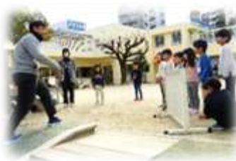
ロープ作戦— うまく引っかかるかな～