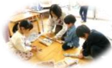
「これで鬼退治するぞ～」 念入りに棒づくり。 (4歳児 しろうく組)