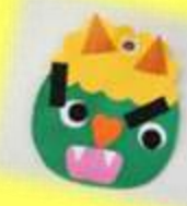
目・鼻・まゆげを つけて鬼の顔 (2歳児 らっこ組)