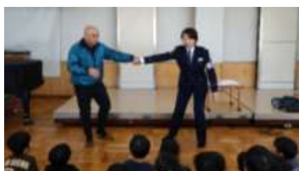
連れていかれそうになったら…！

1月23日(金)、名東警察生活安全課の方に来ていただき、不審者対応の訓練を行いました。4・5歳児は「つ・み・き・お・に」の標語から、不審な人に出会ったときにどうしたらよいか、わかりやすく教えていただきました。