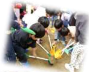
「落とし穴作戦— そばにお酒をおいて おびき寄せます。」