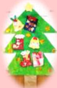
靴下、プレゼントを貼って 大きなツリー (2歳児 ぺんぎん組)