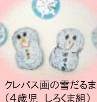
クレパス画の雪だるま (4歳児 しろくま組)