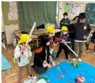
教室で「魚釣りゲーム」 うまく釣れるかな～

保育園に帰ると、「小学校、早く行きたいね～」と小学校への期待を膨らませる子どもたちでした。