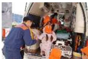
救急車に乗せてもらう 子どもたち。(4歳児)

12月15日(月)、4・5歳児クラスが消防署見学に行ってきました。はしご車を見たり、救急車の中に乗せてもらったり。消防士さんの話に興味津々の子どもたちでした。