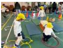
体育館で 「わくわくアスレチック」