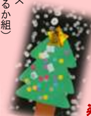
雪の中のツリー (1歳児 きんぎょ組)