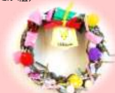
廃材をかわいいリースに！ (2歳児 らっこ組)