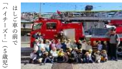
はしご車の前で 「ハイチーズ！」(5歳児)