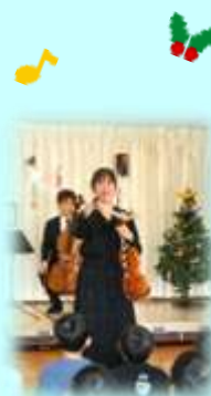
思わず手拍子する、 乳児の子どもたち。