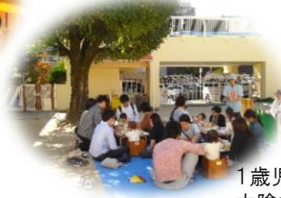
1歳児きんぎょ組 木陰で給食美味しいね！