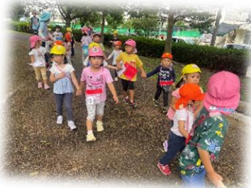
くじら組さんのリードが頼もしい！