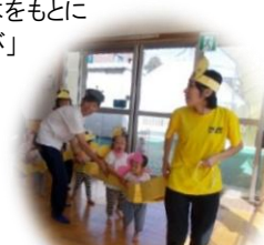
ぺんぎん組 いもむし列車出発！