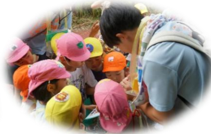
これはどのどんぐりかな～