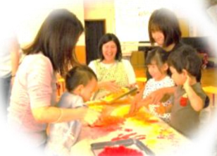
1歳児かに組 ママと一緒に フィンガーペイント！