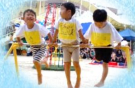
しろくま組・自分たちで考えた技「自転車」

10月5日、会場に集まった人たちの笑顔が、いっぱい運動会になりました。「楽しかった」「また、やりたい」という子どもたちの声も! 運動会を通して身体を動かすこと、表現することの楽しさを感じることができました。