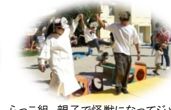
らっこ組 親子で怪獣になってジャンプ！