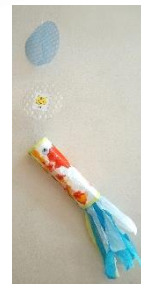
フィンガーペインティングを 模様にした魚 (0歳児 めだか組)