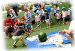
見事、くじら組が 割ってくれたよ！