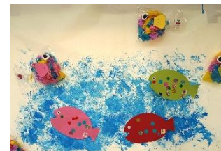
ビニール袋タンポで 海を表現 (1歳児 かめ組)