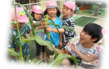
トウモロコシの収穫！ (5歳児 くじら組)