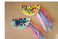
キラキラの魚 (3歳児 いるか組)