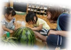
大きなスイカ 触ってみたよ！ (2歳児 らっこ組)