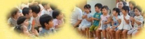
乳児は1階ホール、幼児はあいあいホールで