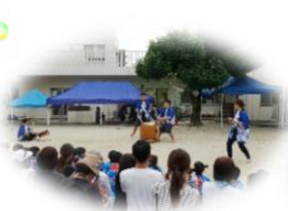
職員によるオープニング 『太鼓囃子』