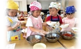
育てた夏野菜でピザ作り！ (4歳児 しろくま組)