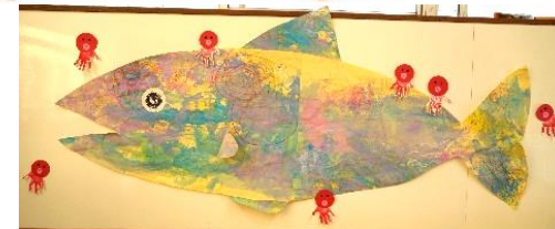
はじき絵で作った大きな魚と手形のタコ (2歳児 べんぎん組)