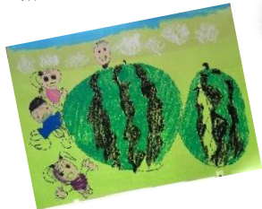
体験画「すいか割り」 (5歳児 くじら組)