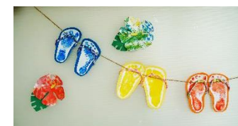
足形のサンダルとタンポのハイビスカス (1歳児 きんぎょ組)