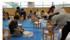
「木を切ってひたすら磨く！」