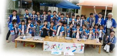
梅ジュース屋さん、大成功！ (5歳児 くじら組)