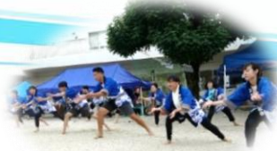
職員によるロックソーラン