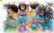
うまく釣れるかな～(名東パラダイスにて)

名東パラダイスの夏祭りに、幼児クラスの子もたちがあそびに行きました。水風船つりをしたり、盆踊りをしたり。香南パラダイスへは、職員が手伝いに行きました。子どもたちや、職員の参加に喜んで下さった皆さん。楽しい交流となりました。