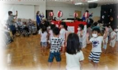
一緒に盆踊り♪(名東パラダイスにて)