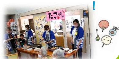
職員がたこ焼き作りのお手伝い。(香南パラダイスにて)