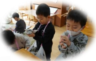
新聞紙で豆づくり！ (3歳児 いるか組)