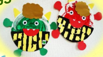
テープをはがして、鬼のパンツの模様ができました! (0・1歳児 きんぎょ組)