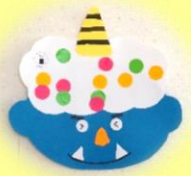
シール貼りの鬼 (0歳児あめんぼ組)