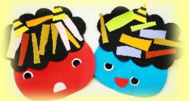
顔をのりで貼ったよ (2歳児べんぎん組)