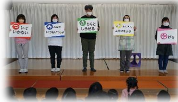
「つみきおに」をみんなで確認