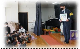
自分の身を守る方法を、紙芝居で教えていただきました。