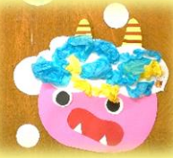
和紙を丸めて貼った鬼 (1歳児 かめ組)