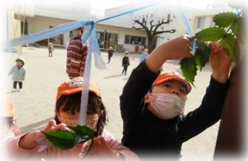
枝を吊るして、鬼の侵入を防ぐ！