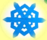
切り紙で作った雪の結晶 (4歳児 しろくま組)