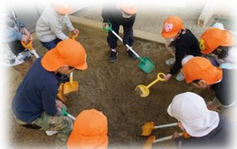
一落とし穴作戦— 入念に穴を掘る子どもたち