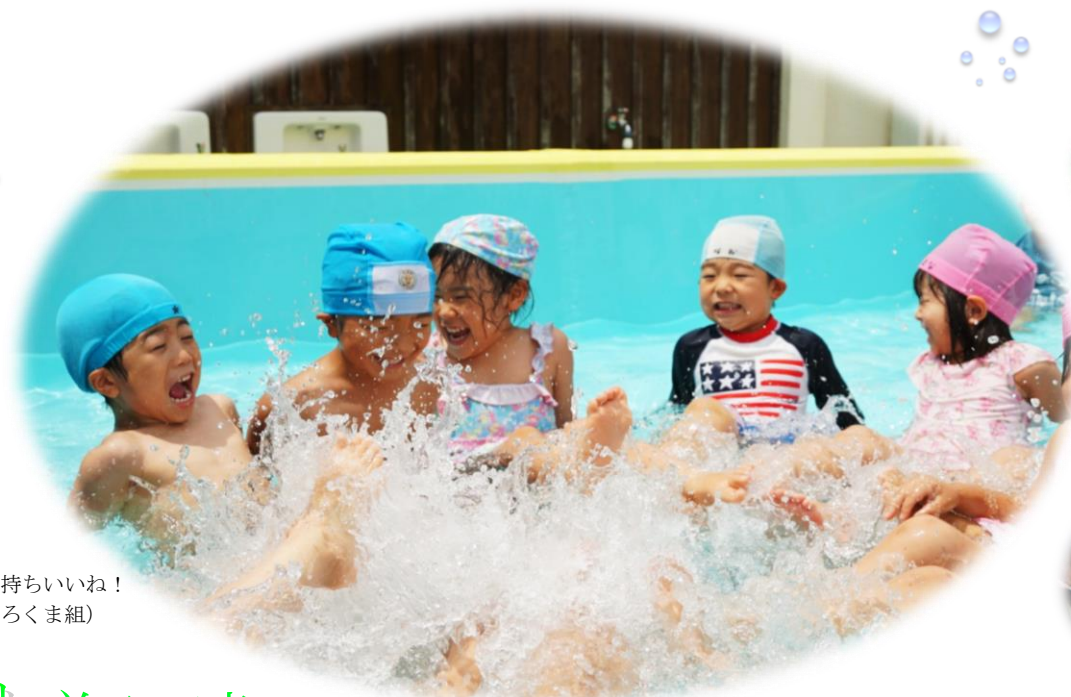
水しぶきが気持ちいいね！ (4歳児 しろくま組)