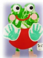
えのぐをぺたぺた。 かえるになったよ！ (0歳児めだか組)

太陽の光にきらきらと輝く水・・・ いろんな形に変化する水・・・ ぽたぽた、バシャバシャ音がする水・・・