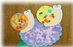
あじさいとカタツムリ (2歳児べんぎん組)