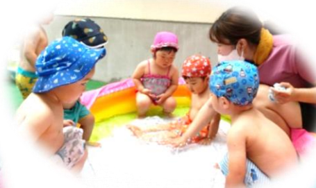
みてみて～お水バシャバシャ (1歳児 かに組)