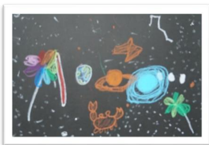
(六月七日くじら組がプラネタリウム見学に行きました。) プラネタリウムで見た「星空」 (5歳児くじら組)