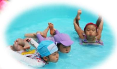
プールで水中かめ！ (5歳児 くじら組)