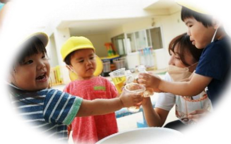
色水遊び。みんなで 「かんぱ～い！」 (2歳児 らっこ組)