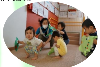
シールを貼ったカエル。ぴよんぴよん跳ねて遊びました(かめ組)