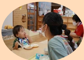
「モグモグ、おいしいね〜」(めだか組)

保育園生活が初めてのこの家庭が多く、仲間がいる安心感が励みに。お父さんの参加も多く、新たな繋がりが。職場復帰して忙しい日々ですが、0、1歳児期のかわいい時期を見逃さないよう、家庭と保育園が伝え合い、安心できる生活を作っていけるといいですね。