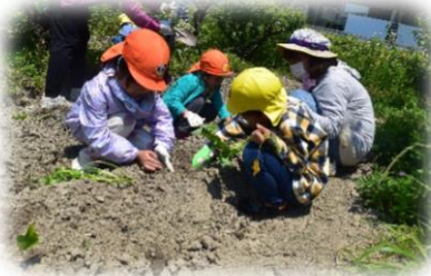
4.5歳児ペアでの植え付け。