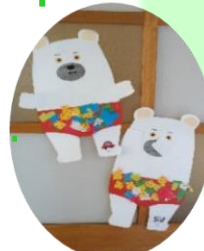
ちぎった紙を貼ったカラフル水着!(かに組)