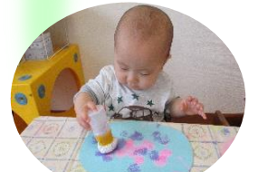
タンポでアジサイ作り。(きんぎょ組)