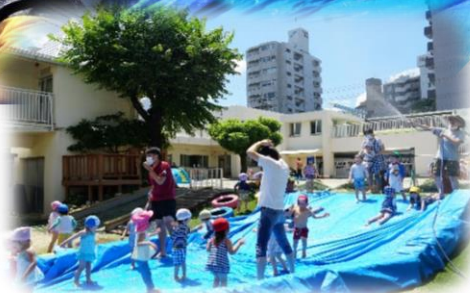
楽しそうな雰囲気、乳児クラスの子どもたちも…。(ぺんぎん、らっこ組)