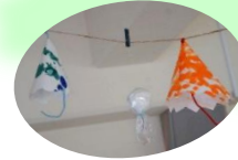
絵具で描いて傘に! (ぺんぎん組)