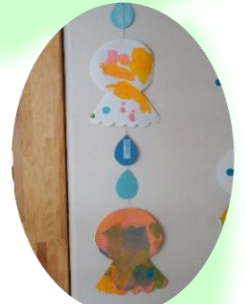
筆を使って、てるてる坊主の出来上がり!(いるか組)