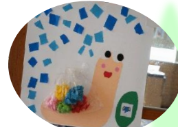
殻はお花紙を丸めて。ちぎった紙を雨に見立ててのりで貼りました。(らっこ組)