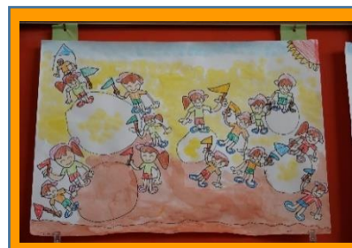
「オープニング」旗パフォーマンスの絵 (くじら組)