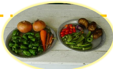
畑で収穫した夏野菜と購入した 玉ねぎ、じゃがいも

くじら組が、感染対策を講じながらのクッキング。 楽しく、おいしく、幸せいっぱいの『夏野菜カレー』 が出来上がりました。