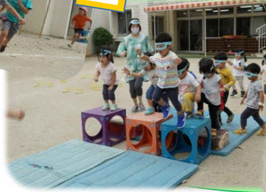
いるか組の真似っこでジャ〜ンプ！(らっこ組)