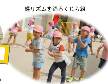
縄リズムを踊るくじら組

台風が去り、秋晴れが続く10月。外へ出て身体を動かすことが気持ちの良い季節。乳児クラス保育参観でも親子で運動あそびを楽しんでいただけるよう計画中です。お楽しみに！