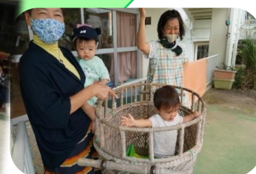
かわいい応援団(あめんぼ組)