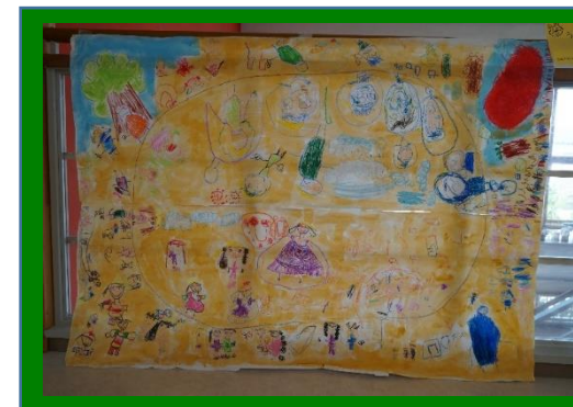
皆で共同画 (しろくま組)