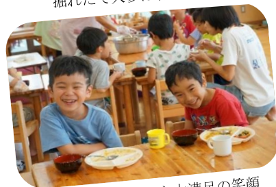
「おいしかった～」と大満足の笑顔