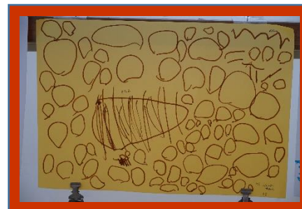
玉入れの絵 (いるか組)