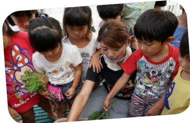
プランターの人参も！ 掘れた人参は甘かった！