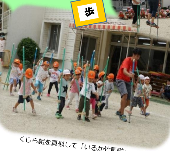
くじら組を真似して「いるか竹馬隊」