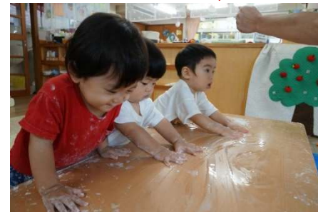
「ドロドロ、ベタベタ楽しいね〜」 片栗粉と水の感触あそび(めだか組)