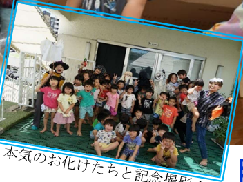
本気のお化けたちと記念撮影！