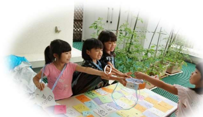
「よく頑張ったね」と声をかけてくれる受付係