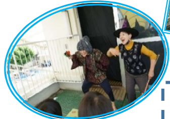
水かけ婆とおばけ案内人