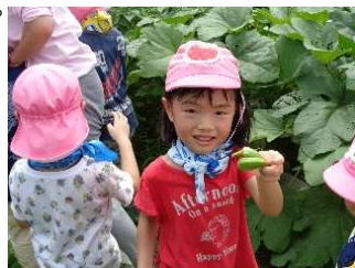
オクラ くるくるに丸まった