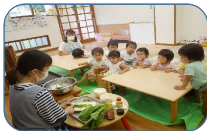
きんぎょ組 小松菜じゃこ炒め