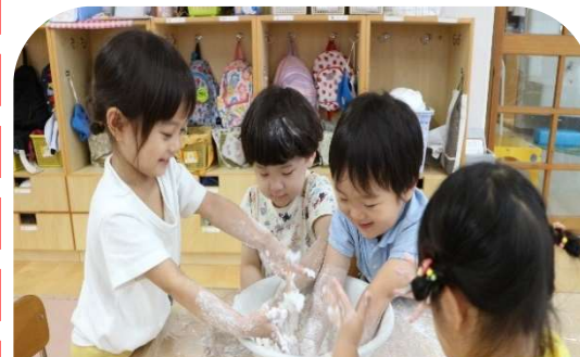
片栗粉にだんだんと水を加えてドロドロに！(らっこ組)