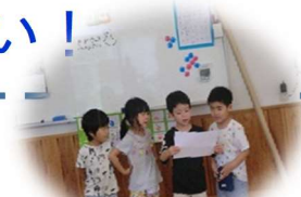
話し合ったことを発表

自分たちで考え、創ったものだからこそ大きな喜びへと変わった「お化け屋敷」。自分の思いを言葉にして相手に伝わるように話す時には、言語力や考える力が発揮されます。また、途中で問題が発生しても、皆で知恵を出し合い工夫し、目的実現へ！共に過ごす友だちや保育士だから、自分の思いを言葉で伝え、相手の思いも知る！。皆と一緒に頑張ってきた！。そんな体験を幼少期に積み重ねて、心と賢さを育んでいき(主任)