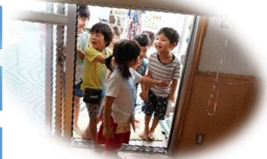
混雑しない為の重要な案内係

シリーズ子ども像② 「目標にむかって知恵をつかいねばり強く歩む子ども」 今号では、「お化け屋敷」(くじら組主催)の取り組みを通して、お伝えします。