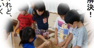
「ここ、おさえてくれる？」

③問題発生！でも、皆で解決！ やる気満々で始まった「お化け屋敷」製作。思いを形にするのはなかなか難しく、問題が続々と。うまく進まず泣き出した子、早く仕上げたくて強い口調になったり、険悪に「子どもたちが何に困っているのか？」と、考えてみると、個々の思いはあるけれど、友だちどう協力し、進めていくのか、戸惑っていることがわかりました。 「考えていることを友だちにわかるように話してみたらどうかな。」の担任の言葉に、少しずつ意見を交わし合い、協力する姿が見られるように。アイデアが集まり、友だちと工夫することでも面白く、楽しい取り組みになっけいきました。そして、無事に製作完了！