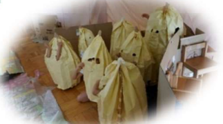
待ち構える「から傘お化け」