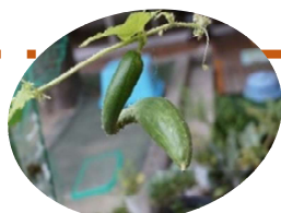
「お店では見かけない 「おもしろきゅうり」