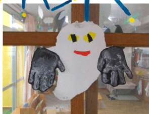
手形を使ったおぼけ製作 『ねないこだれだ』(かめ組)

プランターで育てた野菜で簡単クッキング！ 保育士が、目の前で調理する光景に 一点集中の子どもたち。