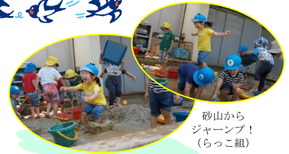
砂山から ジャンプ！ (らっこ組)

名東保育園 〒465-0081 名古屋市名東区高間町 135 Tel (052) 701-2622 Fax (052) 701-2676 HP https://meito-hoikuen.jp/