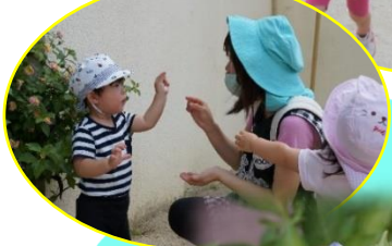
園庭の紫陽花も咲き始めました！