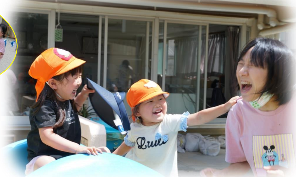
思わず、大笑い！（いるか組）