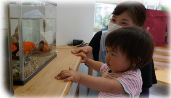
「きんぎょさん、いたね～。」(きんぎょ組)