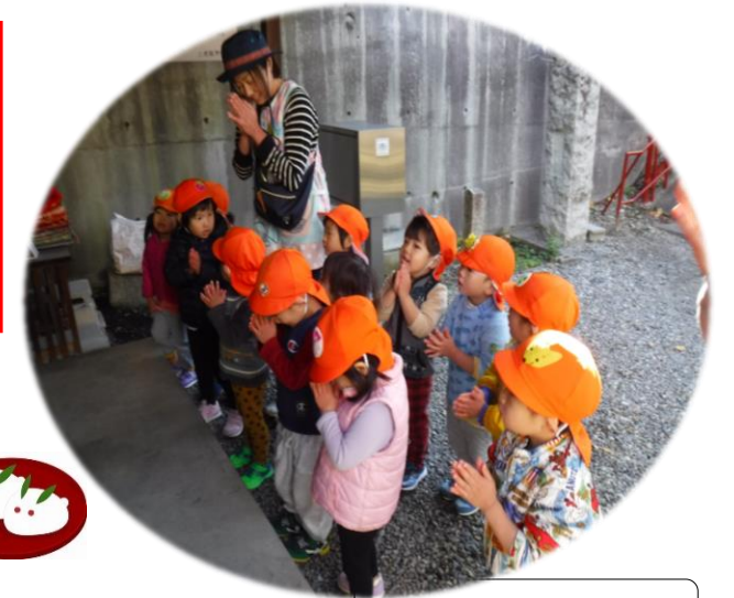
三徳龍神へ初詣(らっこ組)

〒465-0081 名古屋市名東区高間町 135 Tel.(052)701-2622 Fax(052)701-2676 HP https://meito-hoikuen.jp/