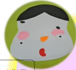
福笑い(ぺんぎん組)