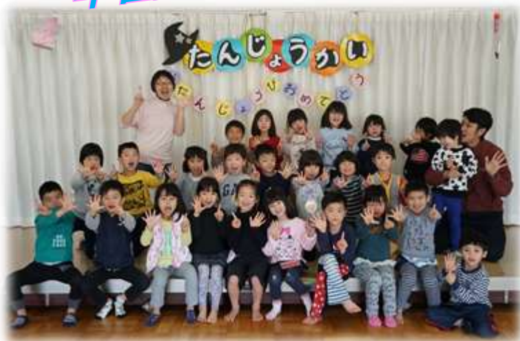
3月の誕生会「全員、6歳になったよ！」

泣いて、笑って、時にはケンカもして、みんなで過ごした日々。 まだ赤ちゃんだった子どもたちが、頼もしいお兄さんお姉さんに！ たくさんの思い出を胸に25人の子どもたちの卒園です！