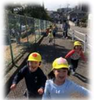
越前公園へしゅっぱ～つ!! いろんな場所へ歩いて行ける ようになったよ。 (2歳児:ぺんぎん組・らっこ組)