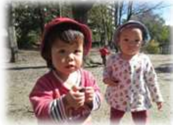
ねんねだった子どもたちも、今では歩けるよう になったよ (0歳児あめんぼ組・めだか組)