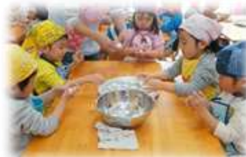
みんなで、みたらし団子作り (3歳児いるか組)