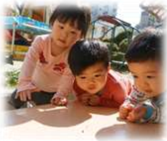
あ！だんごむし!! 春、み～つけた! (1歳児かめ組)