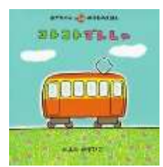
作・絵:とよた かずひこ 出版社:アリス館