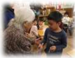
香南パラダイスのお年寄りが、交通安全のお守りを作ってくださいました。ありがとう！！