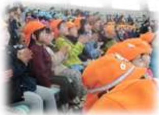
楽しかったお別れ遠足 イルカショー、すごかったよ！