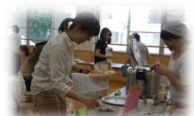
給食室職員との コミュニケーションの場にも

これからも和食を中心にした献立で旬の食材を活かした給食づくりに励みます。子どもたちの「おいしい！」の笑顔を活かすに…！