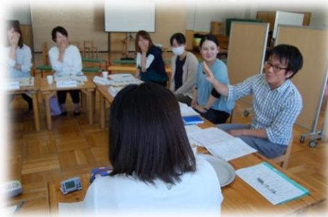
お父さんも大いに語る！（1歳児クラス）