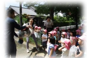
偶然ゴミ収集車が通りかかり、ごみを持って行ってもらって嬉しい子どもたち!。(3歳児いるか組)