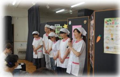
私たちが作っています！

子育てには悩みや苦労がつきもの。だからこそ、子どもたちがたくさんの人の中で育ちながら、お互いの子育ての悩みや喜びを共感しあえる関係に保育園と家庭、親同士がなれたらいいですね。 子どもも大人も共に育て合い、育ち合うあう関係を築いていきましょう。愛情をたっぷりそいで…！ （五月後半から幼児クラスの懇談会が始まっています。次回幼児編へ続きます。）